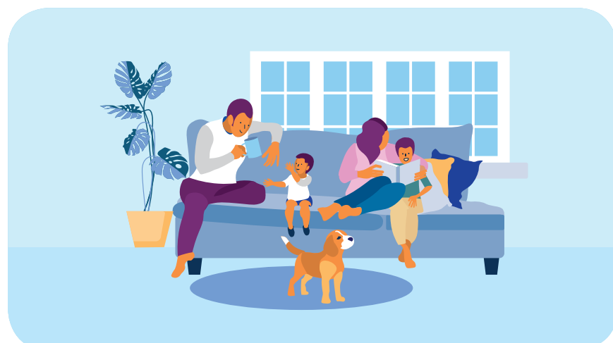
La mamá y su hijo pasan de estar sentados en la mesa de examen a estar sentados en el sofá compartiendo con el resto de su familia. VO: Está cubierta por Medicaid y CHIP...