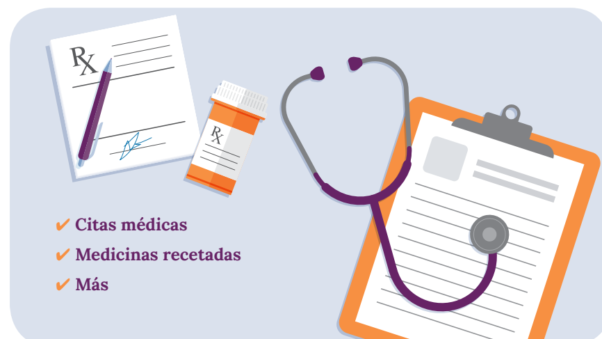
SUPER: Citas médicas, Medicinas recetadas, Más Vemos una tablilla para escribir, un estetoscopio, un talonario de recetas médicas, y una medicina recetada entrar en la pantalla. VO: ...al igual que las citas médicas y más.