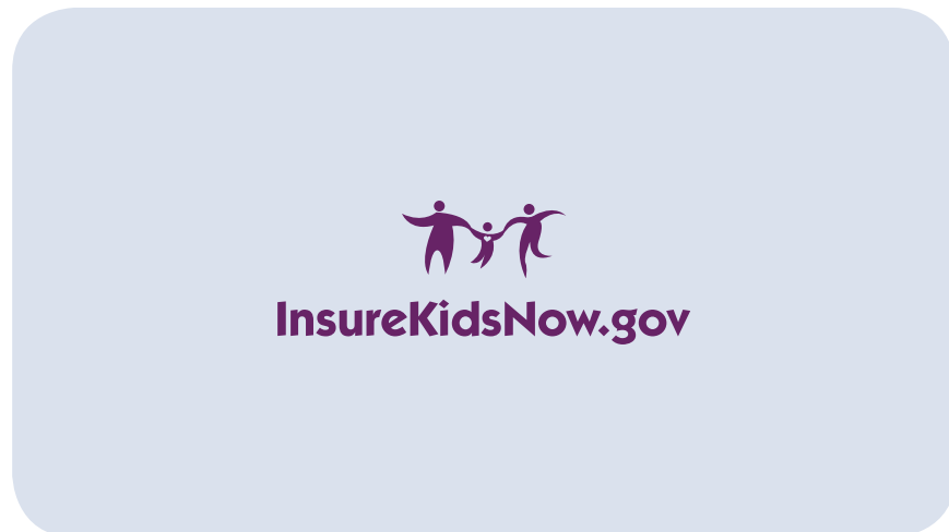
SUPER: InsureKidsNow.gov. Empezamos con el logotipo de InsureKidsNow.gov.