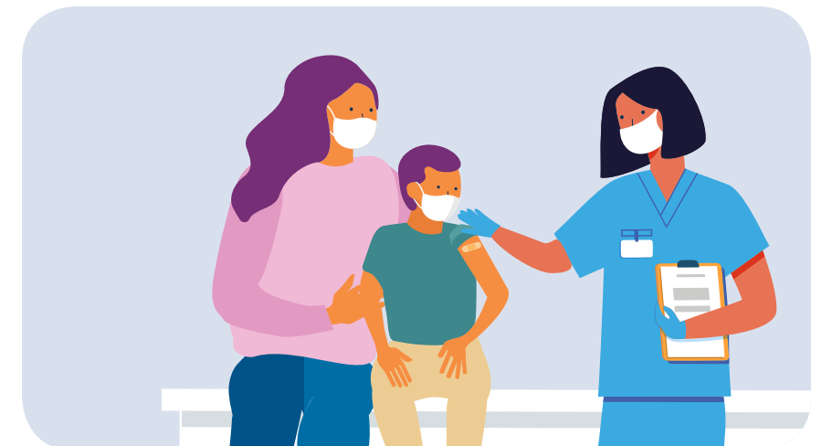
La cámara se aleja para ver la oficina médica con la mamá y su hijo sentados en la mesa de examen después de recibir una vacuna. VO: ...en que familias pueden proteger a sus hijos contra la influenza.