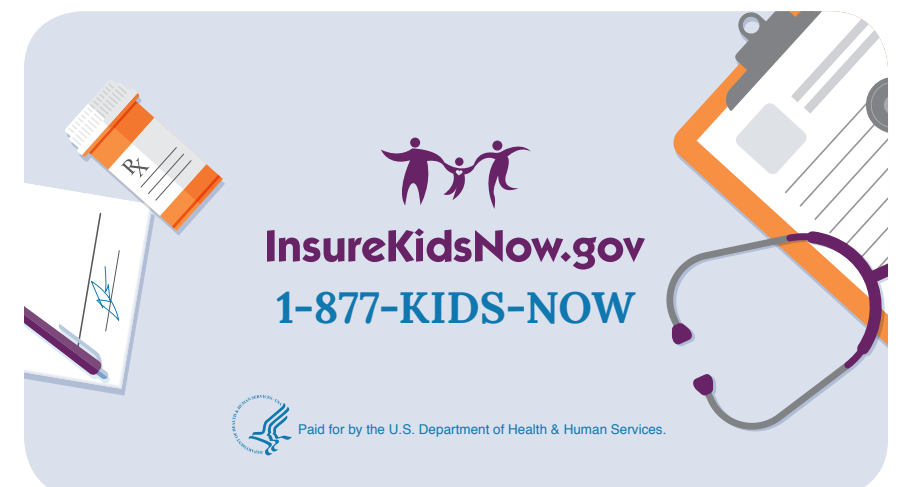
SUPER: InsureKidsNow.gov 1-877-KIDS-NOW Pagado por el Departamento de Salud y Servicios Humanos de los Estados Unidos VO: Visite InsureKidsNow.gov. Pagado por el Departamento de Salud y Servicios Humanos de los Estados Unidos.